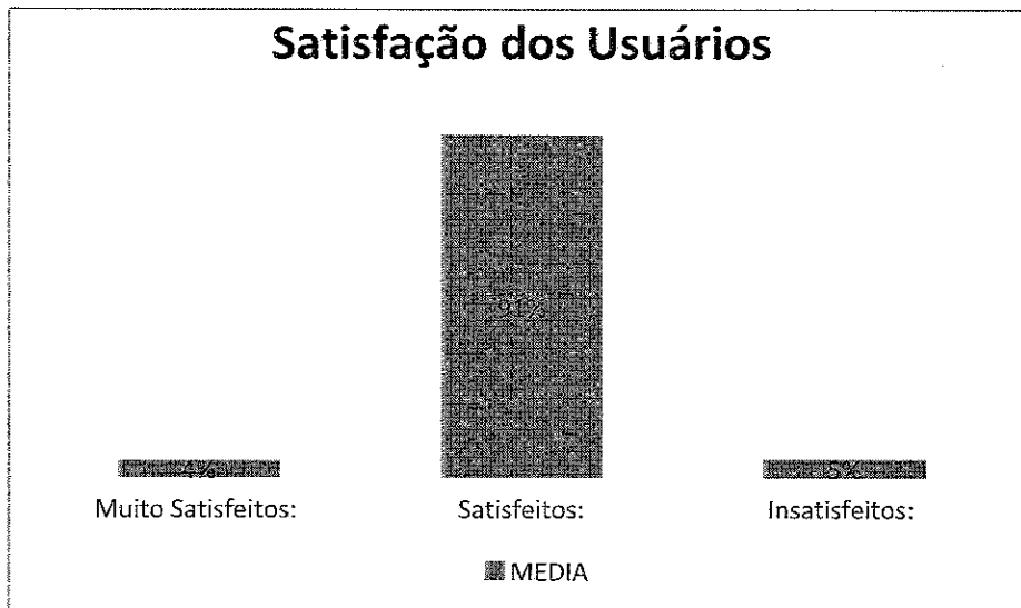
Gráfico 1. Satisfação dos Usuários. HUGO. Jan a mai, 2016.