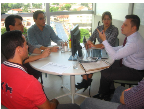
Reunião com o GT do Processo de Apuração Penal da SSPJ

A Otimização de Processos na Secretaria da Segurança Pública e Justiça encontra-se na etapa de análise e melhoria, momento em que é elaborada a "Árvore de Soluções", que contempla os principais problemas levantados, bem como as possíveis causas e soluções para os mesmos.