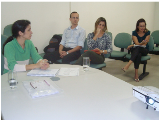
Mapeamento do processo com integrantes da SEGPLAN e da SSPJ, realizado em 29 de maio

Teve início, no fim de maio, o Projeto de Otimização do Processo Corporativo de Captação de Recursos e Execução de Convênios com o objetivo de uniformizar métodos e técnicas utilizadas, remover retrabalhos e atrasos, otimizar recursos, assegurar conformidade com normativos, bem como proporcionar maior clareza de responsabilidades. O escopo compreende o mapeamento e proposição de melhorias abrangendo o levantamento de oportunidades de financiamento, elaboração de projetos, negociação, assinatura do convênio, execução e prestação de contas do convênio e execução dos contratos. Serão mapeados inicialmente: SEDUC, SSPJ, AGETOP, SES, SEGPLAN.