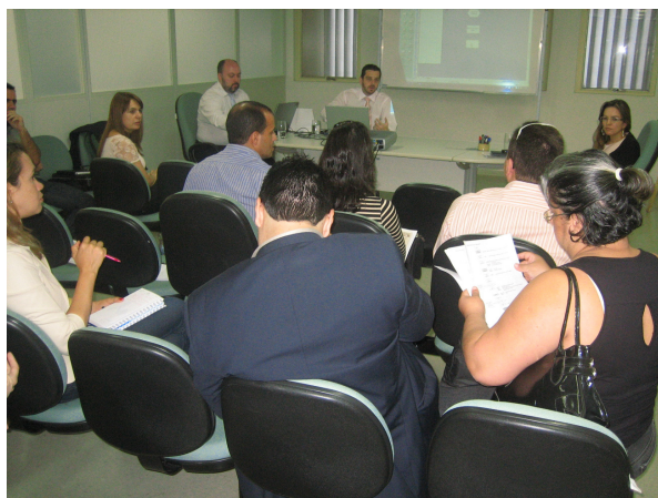
Reunião de Mapeamento do Fluxo da SEGPLAN

A Gerência de Escritório de Processos, juntamente com a GAUSS Consultores Associados, realizaram entrevistas com a Secretaria da Saúde, Educação, Segurança Pública e Justiça e Ipasgo com o intuito de modelar o fluxo do processo de aquisições e contratações para estes órgãos/entidades.