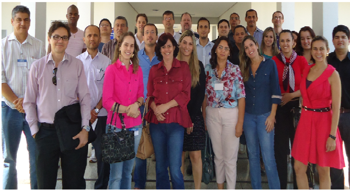
Participantes do Curso

O Escritório de Processos realizou no mês de setembro o curso de Gerenciamento de Processos, com duração de 40 horas, na Escola de Governo Henrique Santillo. Esta foi a sexta turma desde o início de 2012, disseminando a disciplina de BPM e cumprindo a política do Governo de capacitação.