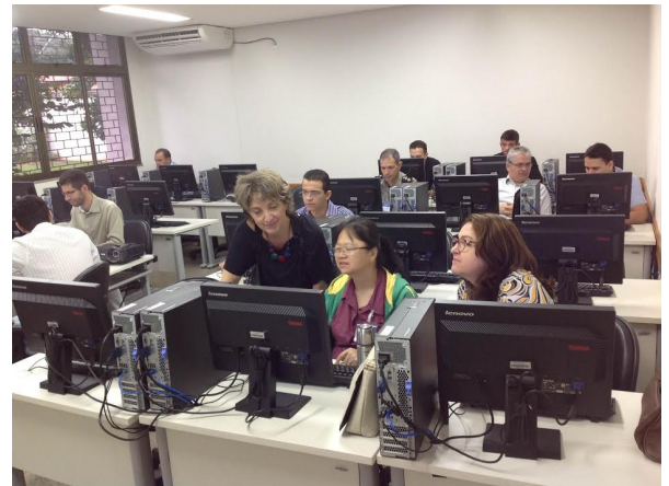
Participantes da 7ª turma do Curso de Gerenciamento de Processos

O principal objetivo é disseminar a disciplina de Business Process Management (BPM), ou Gerenciamento de Processos de Negócio. Participaram do curso servidores das Secretarias de Gestão e Planejamento (Segplan), da Ciência e Tecnologia (SECTEC), da Saúde (SES), da Segurança Pública (SSPJ), da Agricultura (Seagro), da Indústria e Comércio (SIC), além do Ipasgo e Agência Goiana do Esporte e Lazer (Agel).