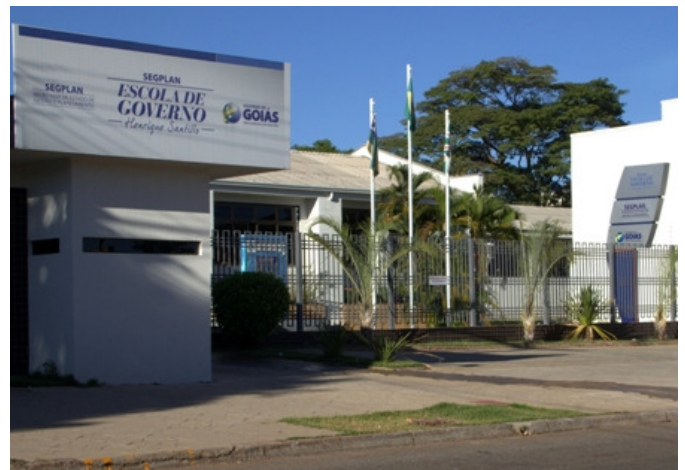
Escola de Governo Henrique Santillo