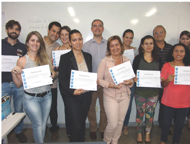
Parte dos participantes do curso

Foi realizado, nos dias 24 e 25 de fevereiro, o curso de Gerenciamento de Processos – Modelagem com BizAgi , no laboratório de informática da Escola de Governo Henrique Santillo, com intuito de promover a melhoria dos processos internos bem como a desburocratização das rotinas afetas à Segplan.