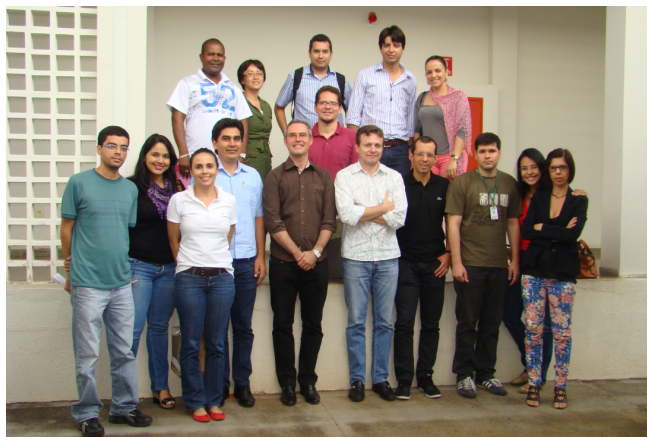
Participantes do curso

Com o objetivo de promover a melhoria da gestão dos processos e a desburocratização das rotinas nos órgãos e entidades da administração pública estadual, a Secretaria de Gestão e Planejamento (Segplan) promoveu, por meio da Escola de Governo, o curso de Modelagem de Processos de Negócio utilizando BizAgi Modeler .