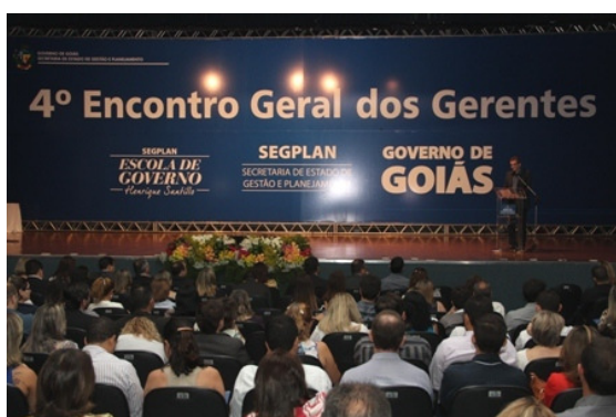
IV Encontro Geral dos Gerentes

A Segplan reuniu, no dia 14 de agosto, mais de 900 gerentes da Administração Pública Estadual para discutir a profissionalização da gestão pública no 4º Encontro Geral de Gerentes . O evento, organizado pela Escola de Governo, contou também com alguns secretários de Estado, superintendentes e servidores convidados de diversos órgãos e foi realizado no Oliveira's Place, em Goiânia.