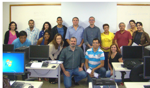
Curso de Modelagem de Processos utilizando BizAgi Modeler, realizado entre os dias 24 e 28 de novembro

Em novembro, a Segplan, por meio da Escola de Governo Henrique Santillo, dando continuidade à política de capacitação de servidores da administração pública estadual, disponibilizou duas turmas de Modelagem de Processos de Negócio utilizando BizAgi Modeler e uma de Gerenciamento de Processos , capacitando um total de 57 servidores.