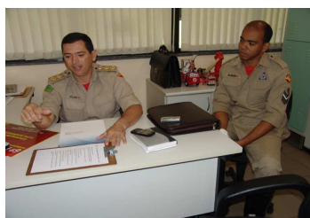
Corpo de Bombeiros Militar

O Escritório de Processos da Segplan, desde a sua criação, no início de 2011, trabalhou com diversos órgãos disseminando e coordenando a cultura de melhoria de processos. O Corpo de Bombeiros Militar e a Polícia Civil criaram suas próprias unidades com a finalidade de trabalhar sistematicamente seus processos. Atualmente, está em fase de implantação o Escritório de Processos na Secretaria da Saúde.