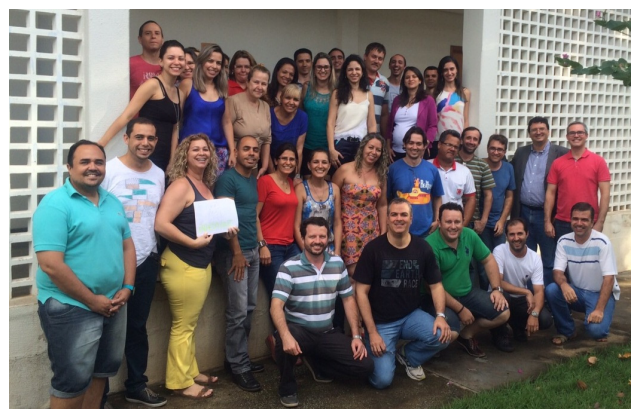
Turma da pós-graduação de Qualidade & Processos

As competências adquiridas serão traduzidas na melhoria da qualidade dos serviços prestados à sociedade.