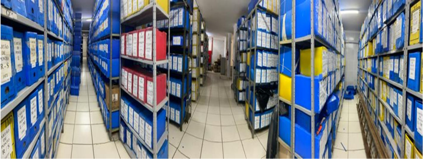
Foto 3 - Estantes de aço e pastas de arquivos com o acervo documental