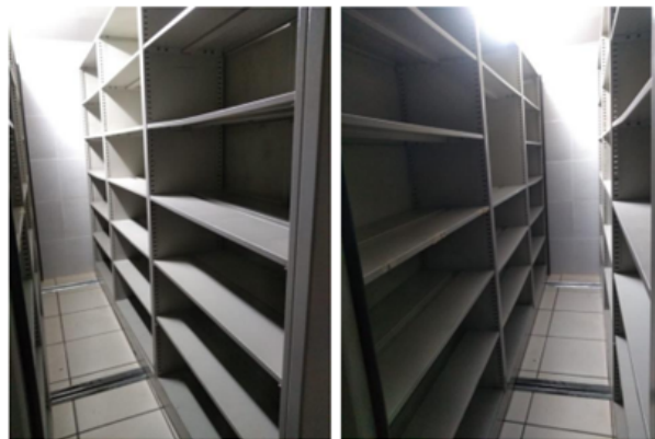
Foto 1 - Arquivo deslizante