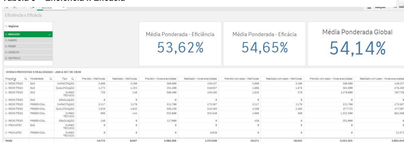
Tabela 8 – Eficiência x Eficácia

Para fins de análise da eficácia, a Tabela 13 abaixo demonstra a média ponderada com os referidos pesos previstos no Chamamento Público, aplicados por tipo de oferta, avaliando o atingimento das metas no decorrer do ano, refletindo o acumulado mês a mês, conforme previsto no Anexo IV do edital de Chamamento Público 05/2016-SED.