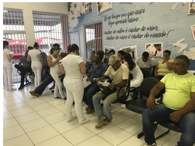
Município de Jataí