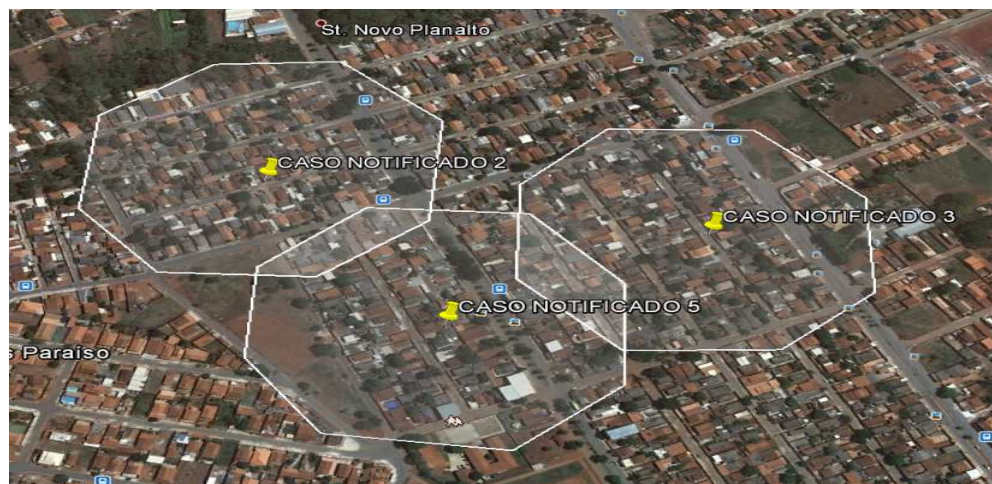
Figura 1. Exemplo de obtenção de área alvo através do Software Web Google Earth

A abertura de raio deve ser feita plotando as localidades prováveis dos casos no croqui do município, através de mapas físicos ou de recursos computacionais (Auto Cad, Google Earth, Google Maps etc). Para cada caso, abre-se um perímetro e, após análise das áreas coincidentes, obtem-se a área alvo, composta por quarteirões, conforme Figura 1.